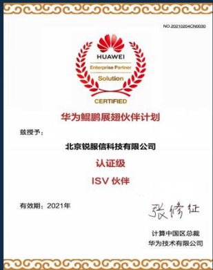
华为鲲鹏认证证书