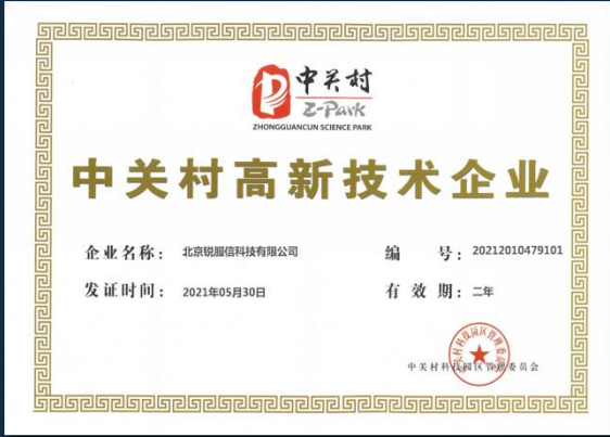
中关村高新技术企业认证证书