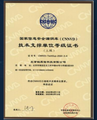
国家信息安全漏洞库 技术支撑单位认证证书