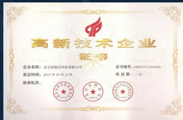
国家高新技术企业认证证书