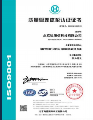
ISO9001质量管理 体系认证证书