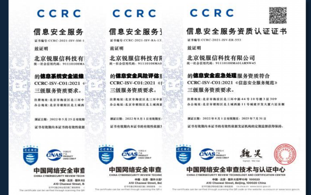
CCRC信息安全服务资质认证证书