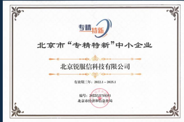
北京市“专精特新”企业认证证书