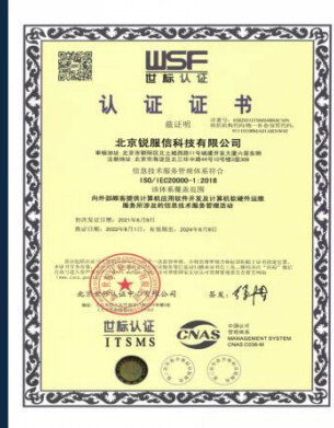
ISO/IEC20000服务 管理体系认证证书