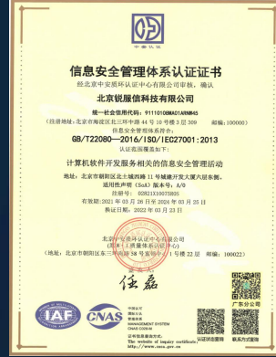
ISO27001信息安全 管理体系认证证书